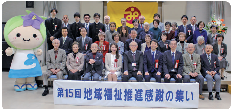
令和5年度「第15回地域福祉推進感謝の集い」参加者の皆様

永年にわたり、鎌倉市の社会福祉に多大な功労のあった方々を表彰し、その功績を讃えることを目的に「地域福祉推進感謝の集い」において表彰式を行います。式典は、11月15日(金)午後1時30分から鎌倉市福祉センターで表彰者をお招きして開催いたします。なお、「第16回地域福祉推進感謝の集い」の様子や表彰者の氏名などにつきましては、次号のかまくら社協だより(令和7年2月1日号)にてお知らせいたします。