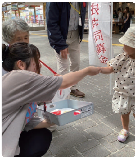
10月1日に実施した街頭募金の様子