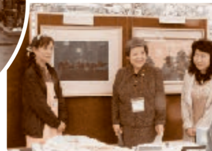
平山郁夫シルクロード美術館による▶サイレントオークション