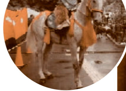
流鏝馬装束と馬(大日本弓馬会)