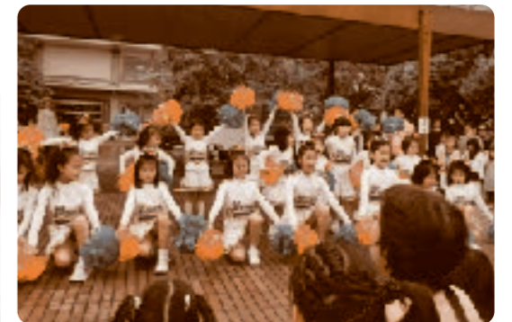
▲鎌倉から日本全国に元気を届けられるよう

参加登録料・バザー・模擬店の収益金(諸経費を除いた)4,544,474円を 鎌倉市がおこなっている「鎌倉市東日本大震災被災者救援募金」へ寄託しました。