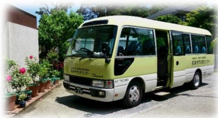
<黄色のマイクロバス>

※この2日間のみ、送迎マイクロバスは「下馬四ツ角」⇄「名越やすらぎセンター」間を運行します。市役所での発着はいたしませんので、充分にご注意ください。