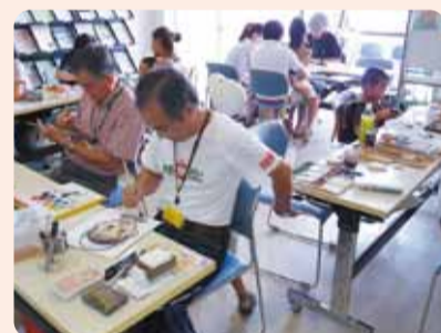
(写真は昨年度の様子です。)