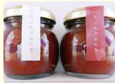
復興支援物品販売コーナー