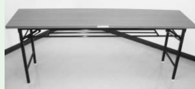
●催事用貸出しテント(1基)と机(7台)