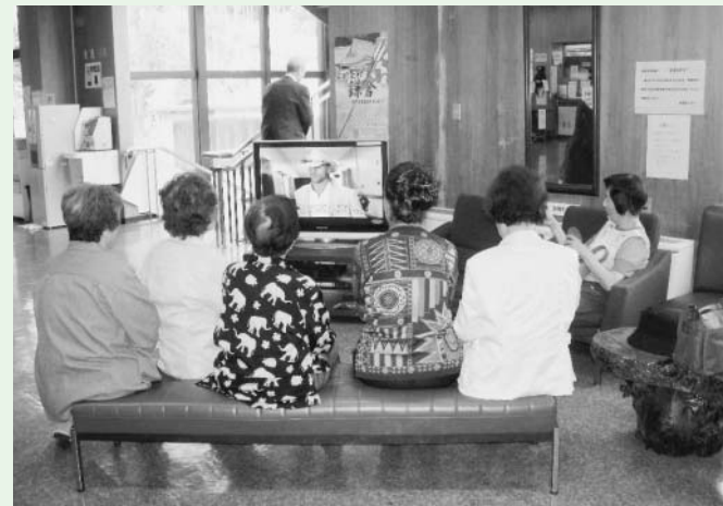
●教養センターに37型プラズマテレビ