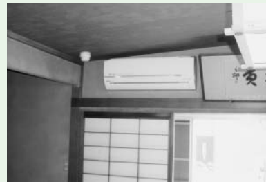
●老人いこいの家こゆるぎ荘にエアコン

※教養センター・こゆるぎ荘 高齢者の健康増進・教養の向上・レクリエーションの場の提供を目的として、生きがいをもって健康的な毎日を送っていただくための施設です。