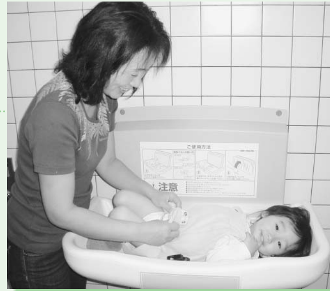
●鎌倉市福祉センター2階多目的トイレに、赤ちゃん用紙おむつ交換台