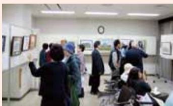
絵画オークション