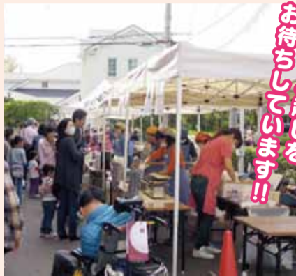
昨年度の様子(模擬店)

誰もが地域の中で安心して生活できるように、また、東日本大震災被災地支援を継続して実施していくために、社協バザー(第2回)を開催します。