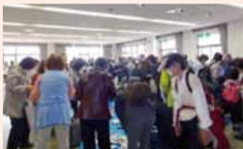
バザー(日用品・雑貨品など)